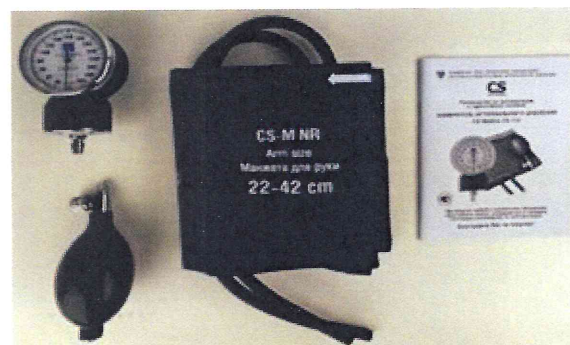
Рисунок 2 – Измеритель мод. CS-112