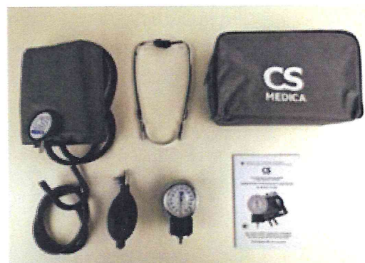
Рисунок 4 – Измеритель мод. CS-205