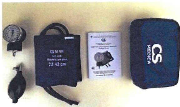
Рисунок 1 – Измеритель мод. CS-103

Место нанесения пломбирования от несанкционированного доступа представлено на рисунке 16.