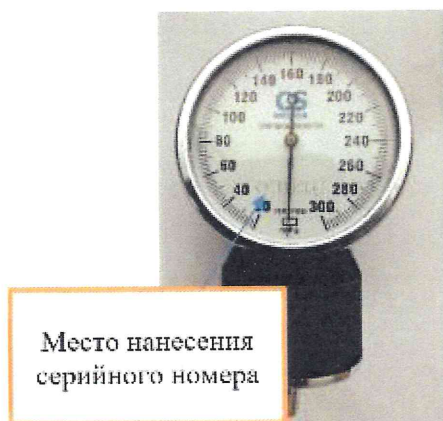
Рисунок 15 – Место нанесения серийного номера