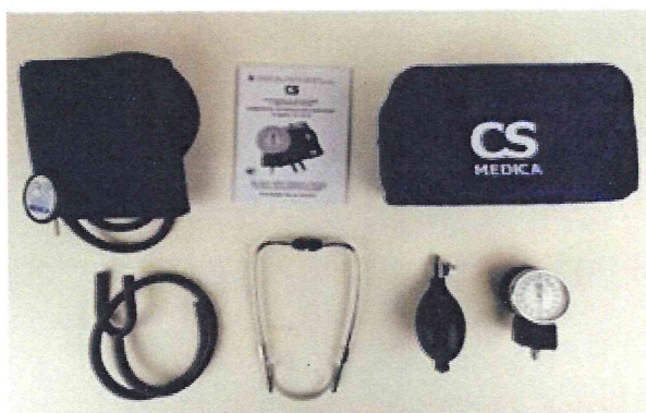
Рисунок 3 – Измеритель мод. CS-105 M