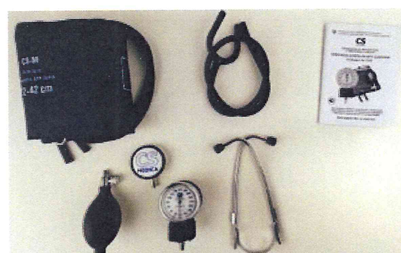
Рисунок 10 – Измеритель мод. CS-116 B