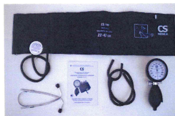
Рисунок 14 – Измеритель мод. CS-117