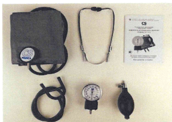
Рисунок 7 – Измеритель мод. CS-115 G