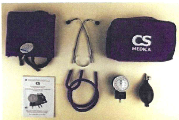
Рисунок 5 – Измеритель мод. CS-305