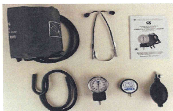
Рисунок 11 – Измеритель мод. CS-116 G