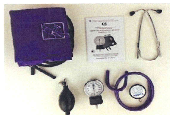
Рисунок 12 – Измеритель мод. CS-116 V