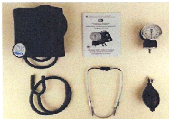
Рисунок 6 – Измеритель мод. CS-115 B