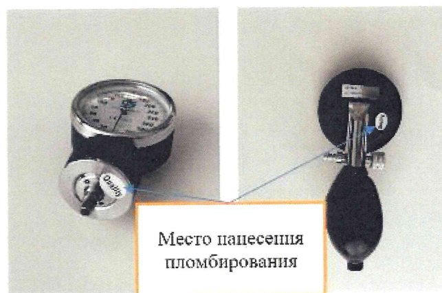
Рисунок 16 – Место нанесения пломбирования от несанкционированного доступа