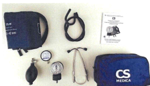
Рисунок 9 – Измеритель мод. CS-106 M