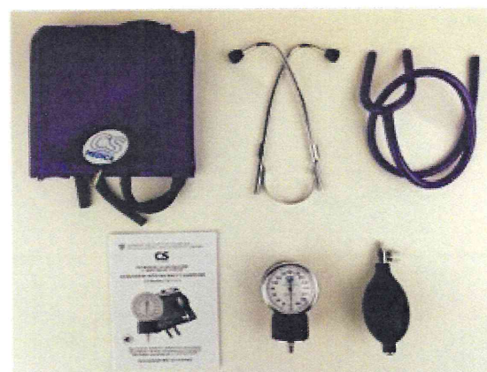
Рисунок 8 – Измеритель мод. CS-115 V