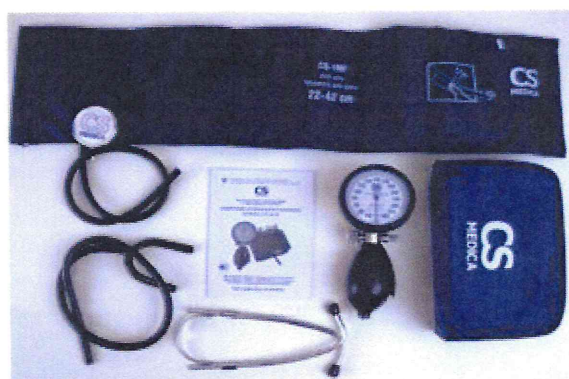
Рисунок 13 – Измеритель мод. CS-107 M