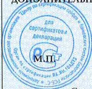
Схема сертификации - 1с