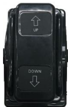
Рис. 1 Педаль управления

Для увеличения высоты столешницы нажмите на сторону педали «UP» и удерживайте до тех пор, пока столешница не поднимется на необходимый уровень. Для уменьшения высоты стола нажмите на сторону педали «DOWN» и удерживайте пока столешница не опустится на необходимый уровень.