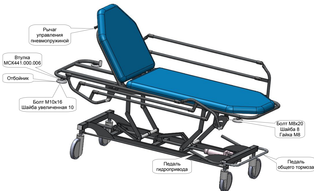
Рисунок 1 — тележка внутрикорпусная ТПБв-01- «МСК» (МСК-441).