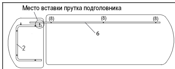
Схема № 1