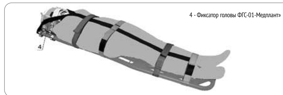
Рис. 2 Щит спинальный иммобилизационный УХН-1А6А в сборе с фиксатором головы складным иммобилизационным ФГС-01-«Медплант».

Фиксатор головы изготавливается из следующих материалов: полиолефиновые листы ПНД (ТУ 2246-006-33513246-2008) производства ООО «ЛАДА-ЛИСТ», (Россия); лента текстильная 100% полипропилен производства ОАО «Лента», (Россия); лента текстильная 100% полиэфир производства ООО «Компания Лента Текс», (Россия); контактная лента (полиамид РА 6 с полиуретановым покрытием PU (latex free) производства Alfateх, (Бельгия); полиэстер НРЕ производства Due Emme S/r/L, (Италия); Isolon 300 и/или Isolon 500 (ТУ 2244-037-00203476-2012) производства ОАО «Ижевский завод пластмасс», (Россия)); полиолефиновый лист ПП (ТУ 2246-006-33513246-2008) производства ООО «ЛАДА-ЛИСТ», (Россия); 100% полипропилен (ТУ 2246-001-55136264-2006, производства ООО «СП КОМПЛЕКТ», (Россия)); винт пластиковый первичный полипропилен РР Н030 GR (ТУ 2211-103-70353562-2010) производства ООО «Тобольск-Нефтехим», (Россия); лента контактная 100% полиамид по ГОСТ 30019.1-93 производства ОАО «Лента», (Беларусь); лента ременная 100% полипропилен производства ООО «АМА», (Россия).