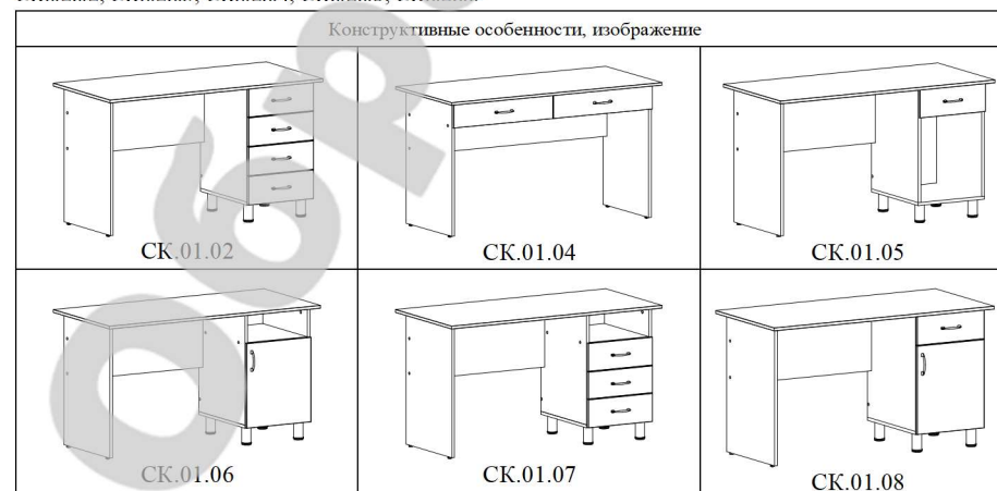
Таблица 4. Стол СК.01.02; СК.01.04; СК.01.05; СК.01.06; СК.01.07; СК.01.08; СК.02.00; СК.02.01; СК.02.02; СК.02.03; СК.02.04; СК.02.05; СК.02.06

4.3 Общие виды изделий показаны в таблице 4.