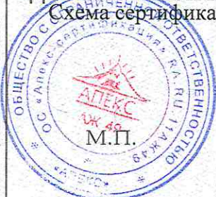
Схема сертификации: 3с.